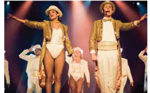
Spectacle musical : "Forever Broadway"