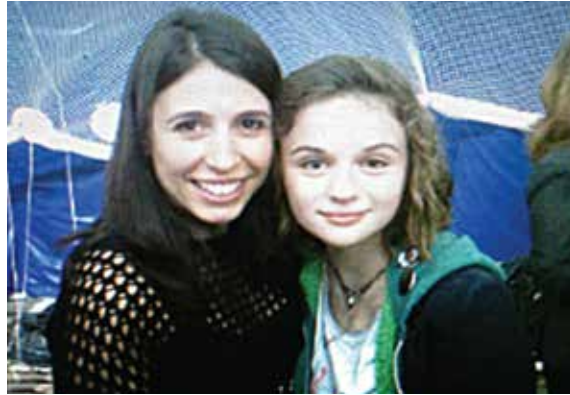
Sur le tournage du film White House Down aux côtés de l'actrice Joey King.