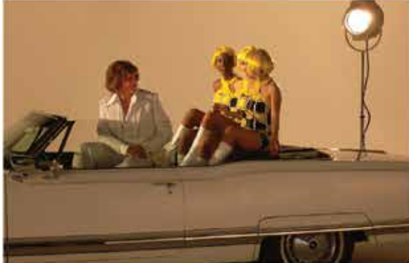
Sur le tournage avec Marc Labrèche