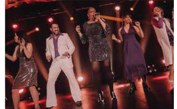
Spectacle musical : "Saturday Night Fever"