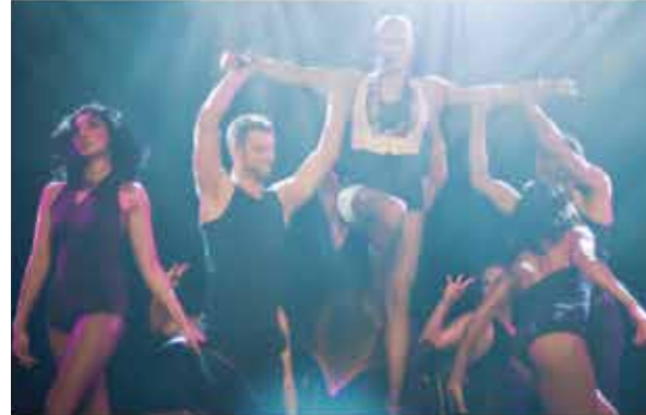
Spectacle musical : "Forever Broadway"