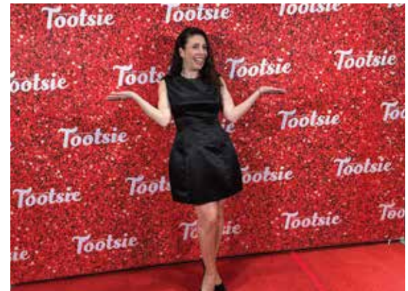
Spectacle musical : "Tootsie"