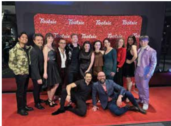
Spectacle musical : "Tootsie"