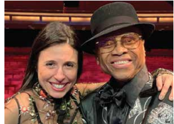
En compagnie de Sonny Turner, le chanteur principal du groupe légendaire The Platters, qu'elle a eu l'honneur de diriger pour la scène de la Place des Arts à Montréal.