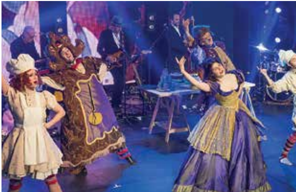
Spectacle musical : "Beauty and the Beast"